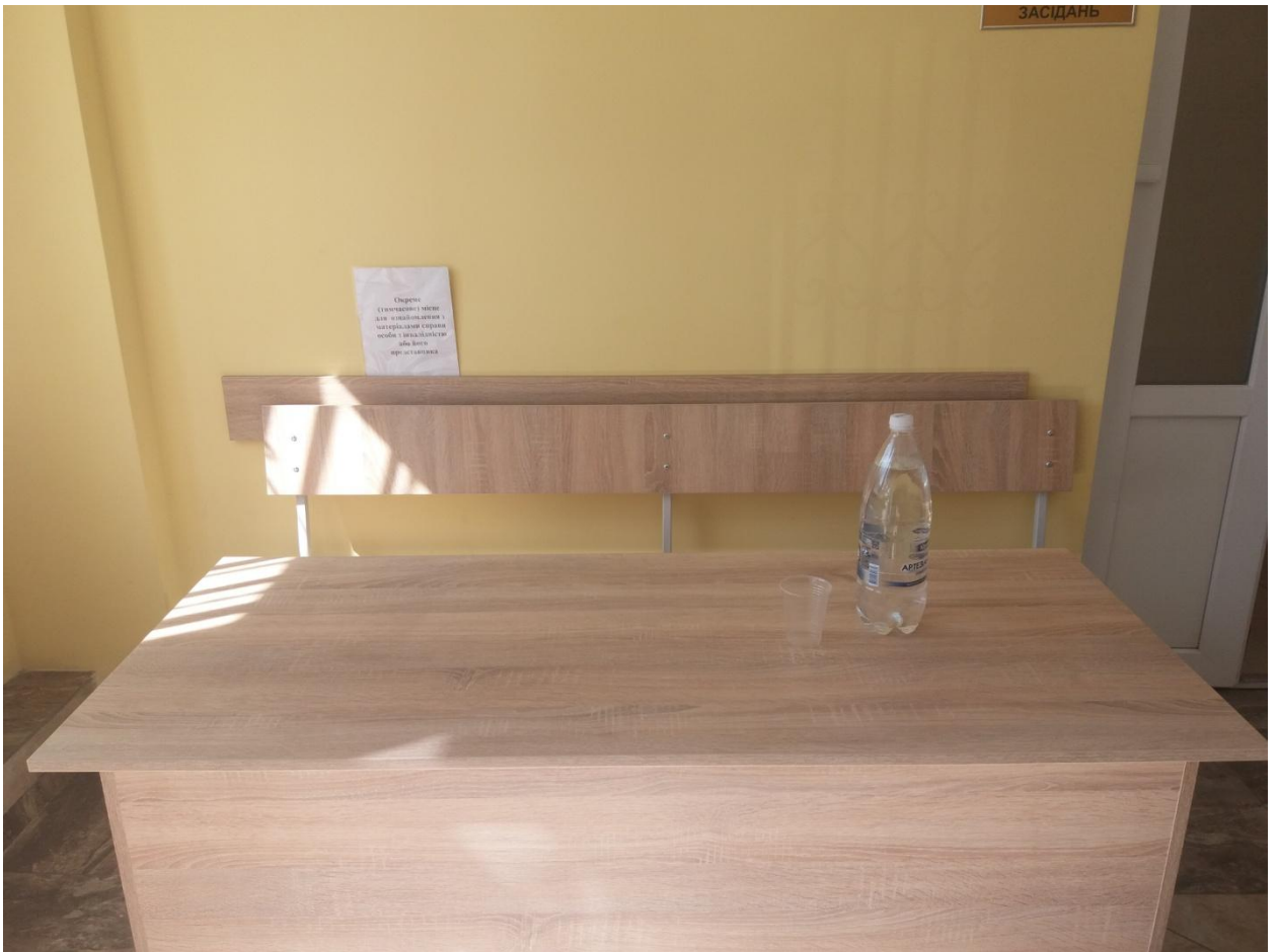
Організація окремого (тимчасового) місця для ознайомлення з матеріалами справи особи з інвалідністю та/або його представника