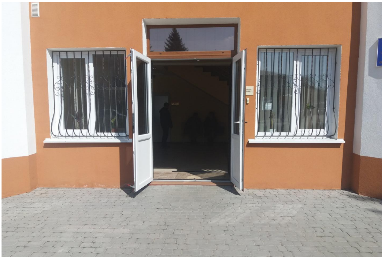
Головний вхід. Сходи відсутні (рівень тротуару співпадає з рівнем входу до будинку)