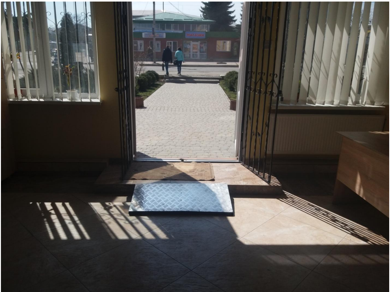
Переносний пандус для забезпечення підйому МГН з рівня входу на рівень приміщень "вільного доступу" (канцелярія, приймальня, зали судових засідань)