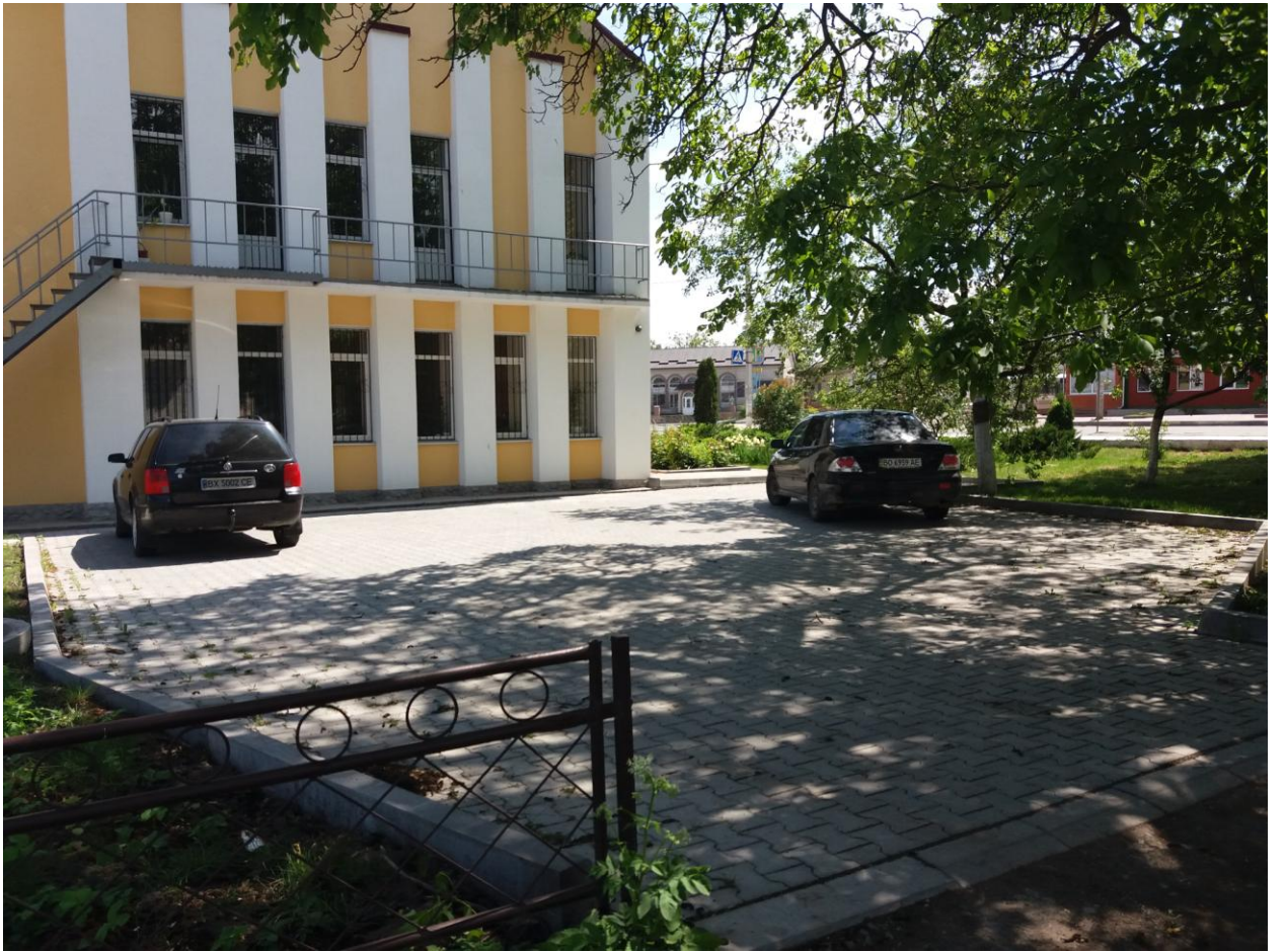
Облаштування місця для парковки автомобіля