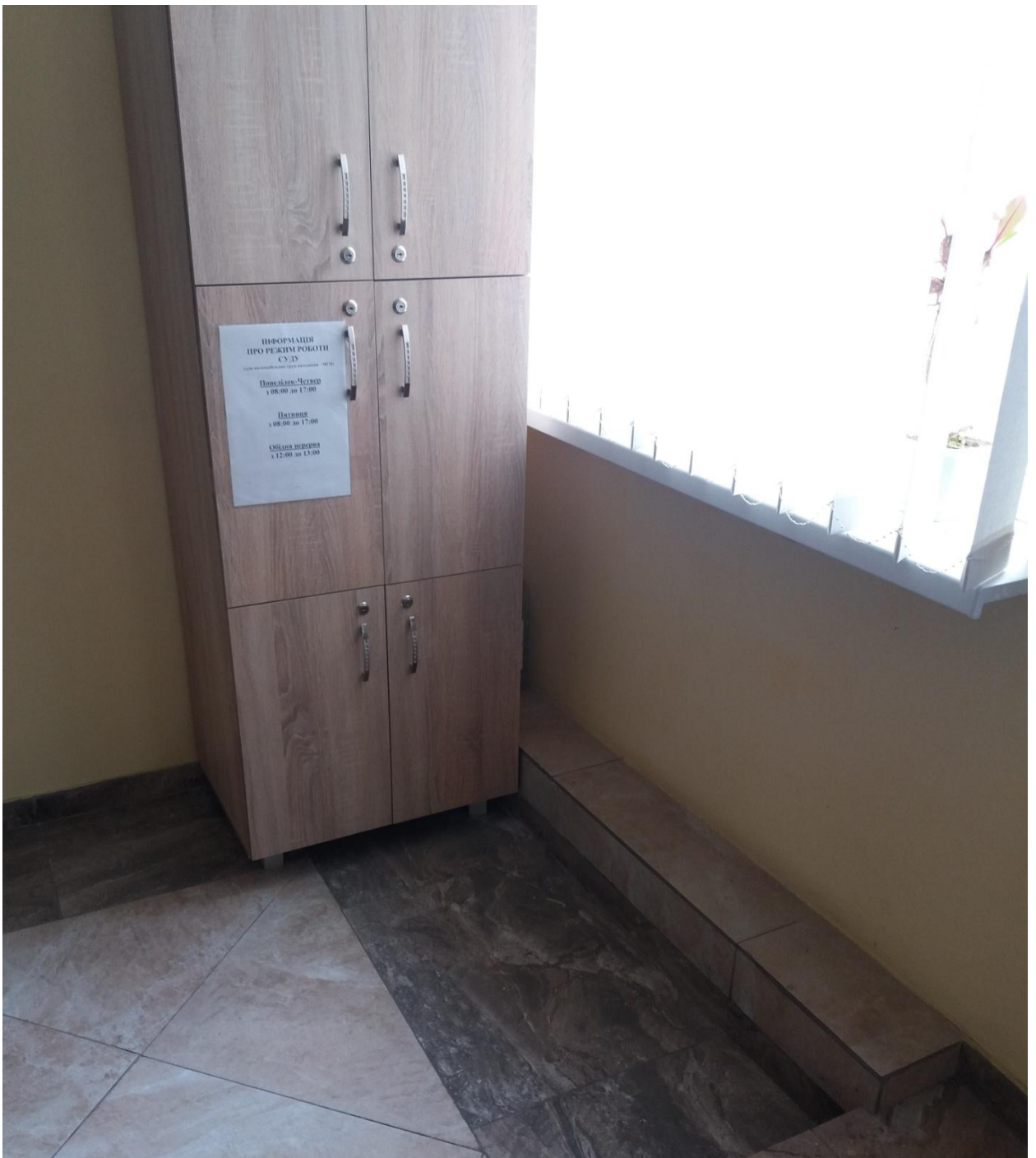
Розміщення інформації про режим роботи суду поруч із входом на видному місці